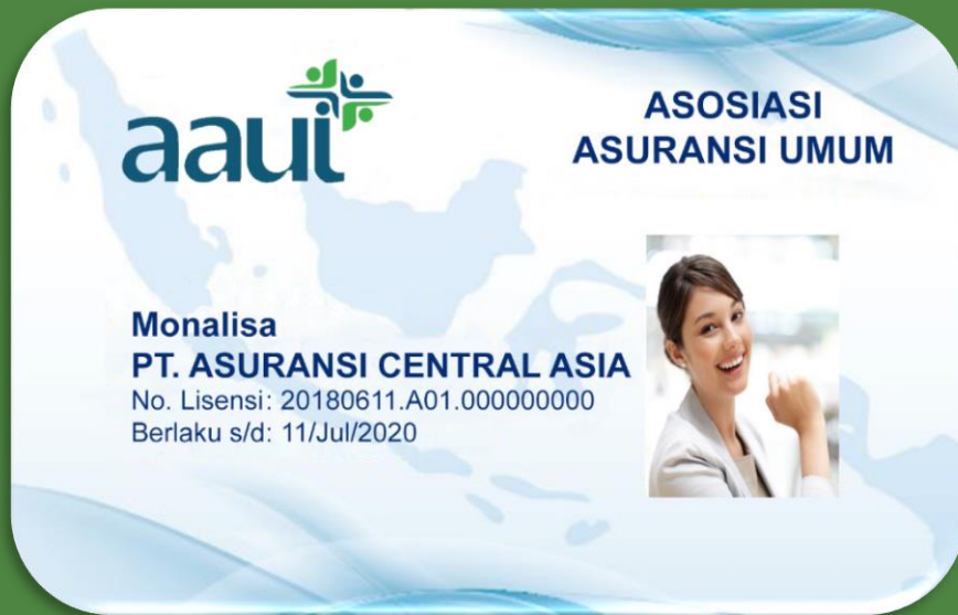
Gambar: Contoh Kartu AAUI Agent Active