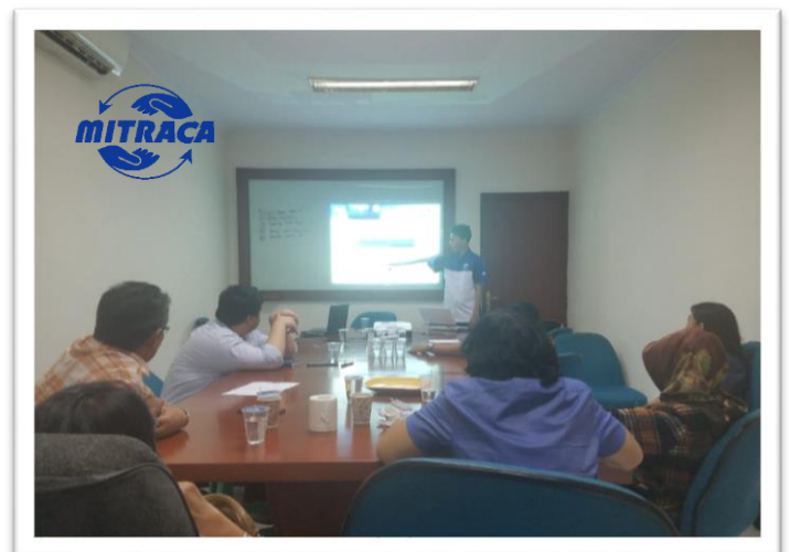
foto: Peserta Training PIC Keagenan di ACA Cabang Bogor

Nantikan kehadiran kami berikutnya di kota anda!