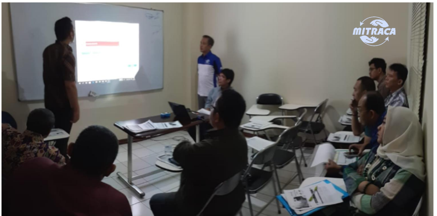
Foto: peserta training agent Mitraca & Konvensional cabang Bekasi

K amis, 19 Juli 2018 lalu, kegiatan sosialisasi training benefit mitraca dan training Motor Car kembali diadakan di ACA cabang Bekasi yang berlokasi di Komplek Mitra Bekasi Blok B No.5, Jln. Ir. H. Juanda No.151, Bekasi. Peserta yang hadir berjumlah 8 orang yang merupakan agen-agen baru gabungan Mitraca & Konvensional.