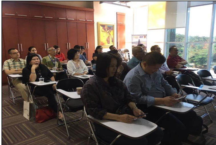
Foto: Peserta Ujian E-Certification AAUI di ACA Kemayoran

T anggal 16 Juli 2018 lalu, Agency Department menggelar ujian AAUI e-certification untuk agen-agen ACA Se-Jabodetabek. Terdapat 20 peserta agen Mitraca yang mendaftar dan mengikuti ujian. Ujian AAUI e-certification ini dilaksanakan di kantor ACA Kemayoran dan dimulai pukul 09.00 wib.