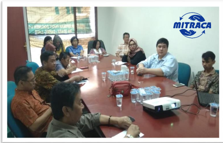
foto: Peserta Training Agen Konvensional & PIC Keagenan ACA Cabang Bogor

D emi meningkatkan produktifitas serta jumlah populasi agen, agency department berkomitmen untuk terus meningkatkan kualitas pelayanan, program pengembangan dan pelatihan bagi agen dan PIC keagenan di seluruh cabang PT Asuransi Central Asia.